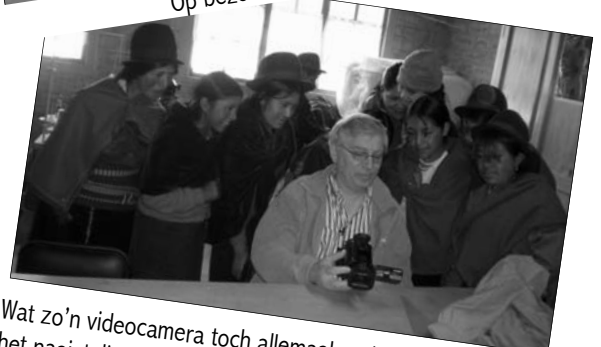
Wat zo'n videocamera toch allemaal registreert in het naaiatelier!