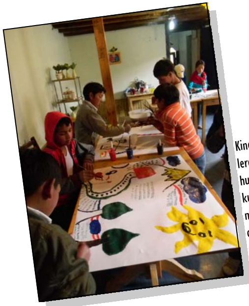
Kinderen leren hun eigen kunstwerk maken onder leiding van een kunstenaar.