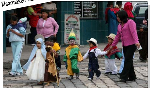
Kerststoet met de kinderen van de prekindergarten