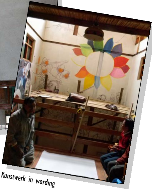
Kunstwerk in wording