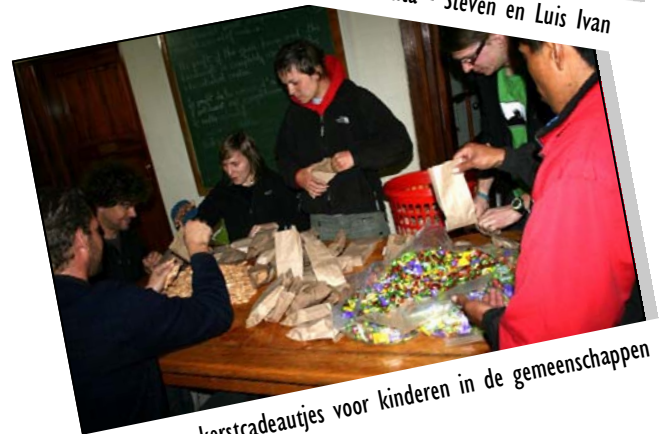
Klaarmaken kerstcadeautjes voor kinderen in de gemeenschappen